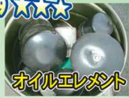
オイルエレメント