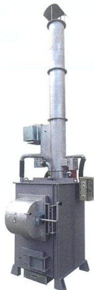
SPII MODEL 廃プラ対応 強力消煙タイプ