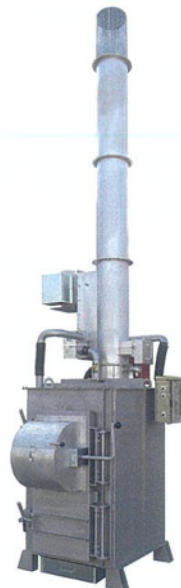
SPZ MODEL 廃プラ対応 大型投入口タイプ