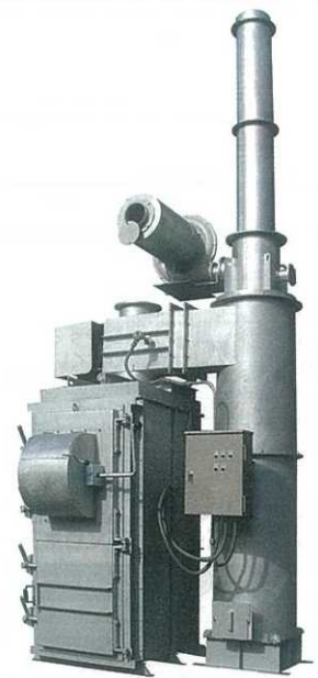
AGX MODEL 雑芥用(大型ゴミ)