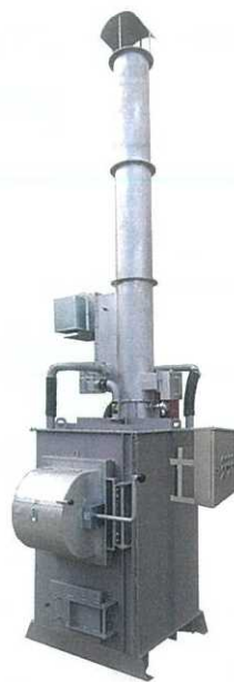
SPII MODEL 廃プラ対応 強力消煙タイプ