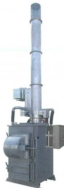
SPZ MODEL 廃プラ対応 大型投入口タイプ